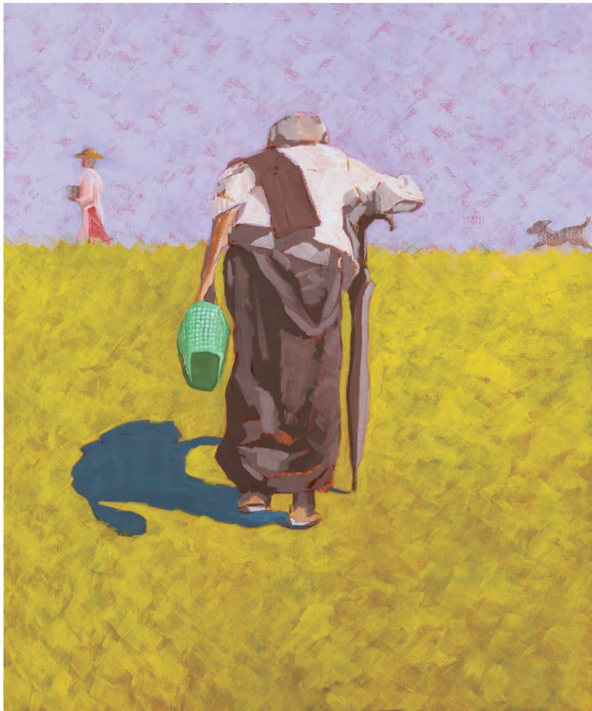
第31回展写真実表現部門大賞「ミャンマーの僧院にて-3」