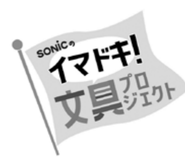
10月1日～11月30日まで実施