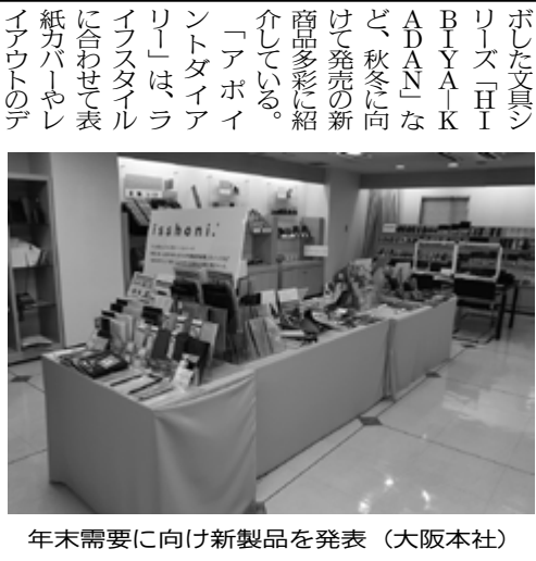
年末需要に向け新製品を発表 (大阪本社)