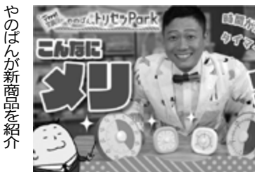
やのばが新商品を紹介

「毎日花で彩る家計簿」(4枚入り、4種)が登場。11月発売は、日記帳「EASYS JOURNAL」(フ