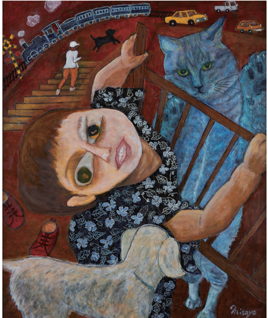
第30回展覧会表現部門大阪府知事賞「再会」