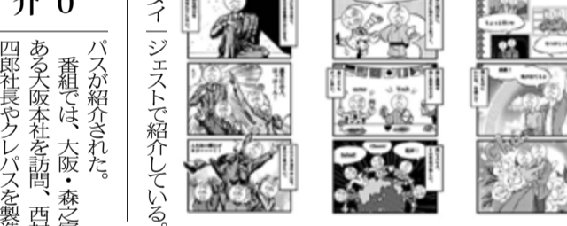
人生の節目に焦点当てたストーリー展開で