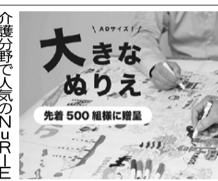
大きなぬりえ 先着500組様に贈呈

人気のテンプレートの上位 ズ(写真)をオンラインストアと、リアル店舗「Blue u Blue(ブルーブルーエ)」の各店で発売している。 ズ(写真)をオンラインストアと、リアル店舗「Blue u Blue(ブルーブルーエ)」の各店で発売している。