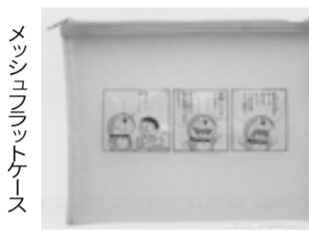
メッシュフラットケース

花、野菜、果物などの身近な物のスケッチ、はがき絵に最適な6色の顔彩(紅、白、若草、黄、白群、水、フィス水筆ペン)・m・r・n中(筆記録は約0.5〜1.5mm)・筆携携サインペン細字/黒がセットになっている。1200円。税別。