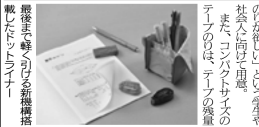
最後まで軽く引ける新機構搭載したドットライナー