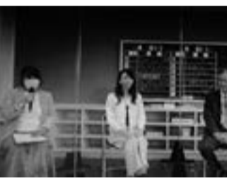
トーケセッションの様