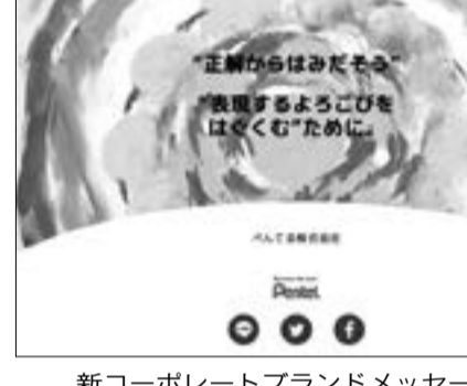
新コーポレートブランドメッセージ